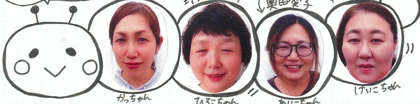
かっちゃん ひろこちゃん あいこちゃん けいこちゃん