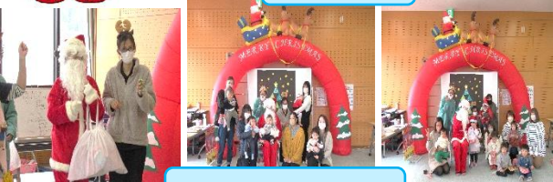
ゆっぴい(クリスマス会)