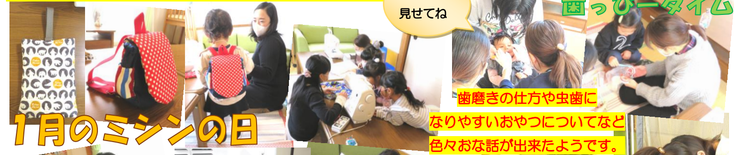
歯磨きの仕方や虫歯に なりやすいおやつについてなど 色々お話が出来たようです。