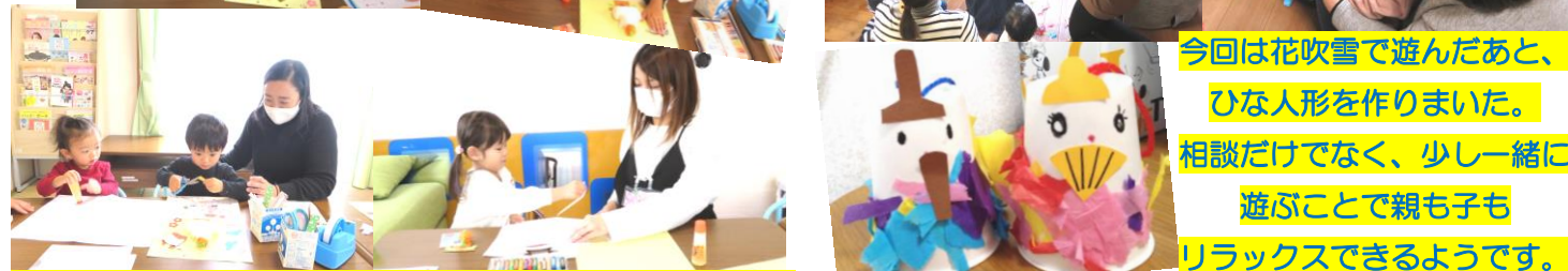
今回は花吹雪で遊んだあと、 ひな人形を作りました。 相談だけでなく、少し一緒に 遊ぶことで親も子も リラックスできるようです。