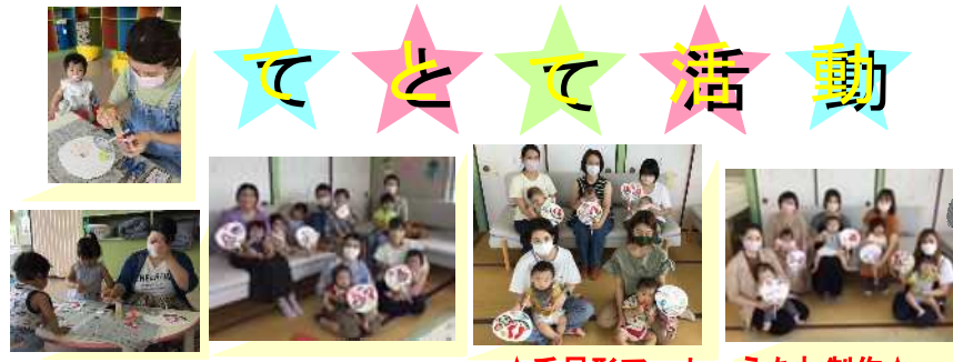
☆手足形アート・うちわ制作☆