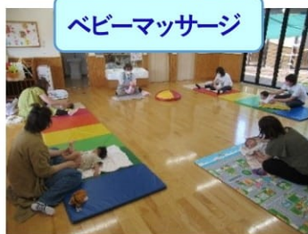
ベビーマッサージ