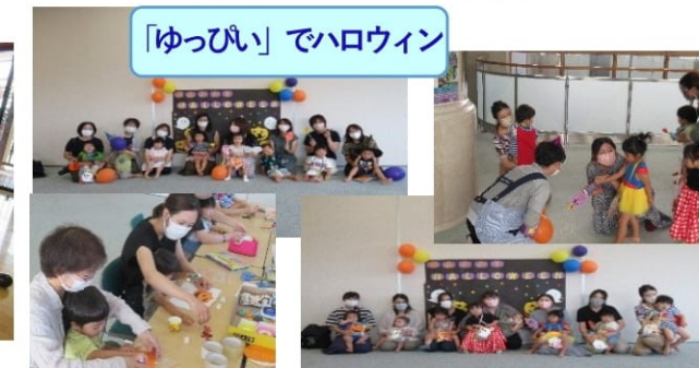
「ゆっぴい」でハロウィン