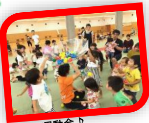
ミニ運動会♪ できる事たくさん増えたよ(^o^)