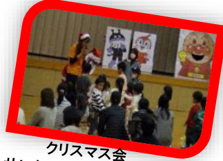
クリスマス会 サンタさんがきてくれたよ♪