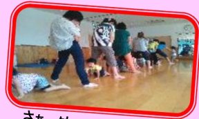
さあ、外へ踏み出そう! 楽しいことがきっと待っている...☆

【内容】親子のスキンシップを大切に、 いろいろなリズムを感じて楽しく体を動かしましょう♪