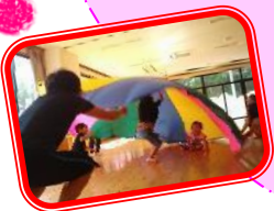
スポーツクラブならではの 体をたくさん動かしてリフレッシュ!!