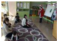
★お誕生日会&クリスマス会★